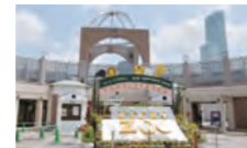
五位堂駅から天王寺動物園は、車でも電車でも約1時間で行くことができます!