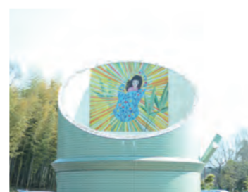
竹取公園のある場所は、あの竹取物語の舞台と言われる場所です。