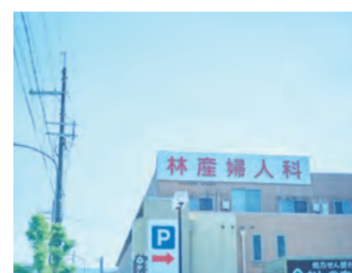
林産婦人科は五位堂駅からアクセスが良く通いやすい病院です。