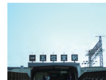
大阪都心に30分というスムーズな交通アクセスが魅力の近鉄「五位堂」駅。