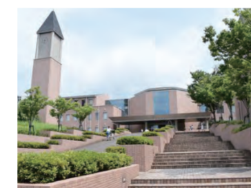
健康と教育のスペシャリストを育てる総合大学の畿央大学があります。