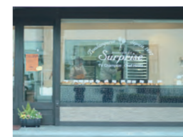
厳選素材でじっくり焼き上げたおいしいパンが並ぶブルーランジェリー・シュルプリー