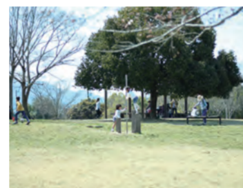
高塚地区公園では、ゆったりとした時間を過ごすことができます。