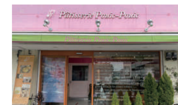
パティスリー ピックピック 〒639-0252 奈良県香芝市穴虫96-9 ホリカワビル103 TEL 0745-77-0301 営業時間 / 9:00~20:00 定休日 / 不定休

ひとりひとりのお客さまとの関わりを大切にしています。幼かったお客さまが成長しても来てくれるのは、やっぱり嬉しいですね。地域密着でやって来たからこそ、「お客様の顔を見てから、作る。」そんな店を、これからも目指していきたいです。