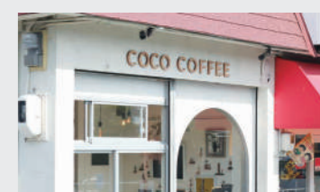
COCO COFFEE 〒639-0251 奈良県香芝市逢坂6-1-1 TEL 050-5273-6463 営業時間 / 土日 7:00~18:00 水木 9:00~22:30 定休日 / 月・火・金曜日

毎日の生活の中でコーヒーを楽しめる、そんな時間をつくりたいと思ってお店をはじめました。よくイベントや個展もしているので、気軽に楽しめるコンテンツをいろいろなカタチで提供して、そこにコーヒーがあればいいなと思っています。