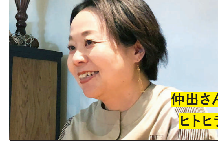
仲出さん ヒトヒラ