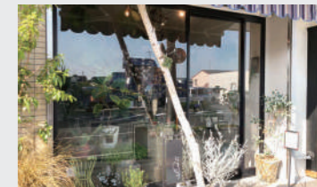
ヒトヒラ 〒639-0252 奈良県香芝市穴虫82-1-101 TEL 0745-43-6087 営業時間 / 10:00~19:00 定休日 / 木曜日

お客様の想いに、とことん寄り添います！こだわりや完成形への想いが強いから、お待たせする事もありますが(笑)風通しの良い居心地のいい空間作りを目指しています！